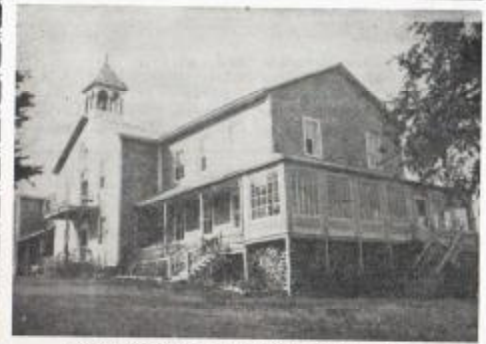
Le "vieux" Cénacle, première "Maison" des Soeurs du Clergé.