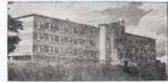
Maison-Mère des S.S. du Clergé