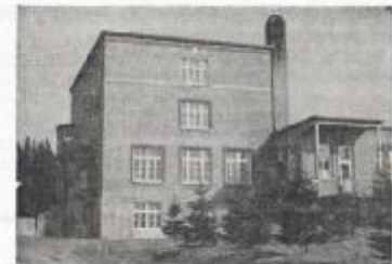
Noviciat des P.N. du St-Esprit